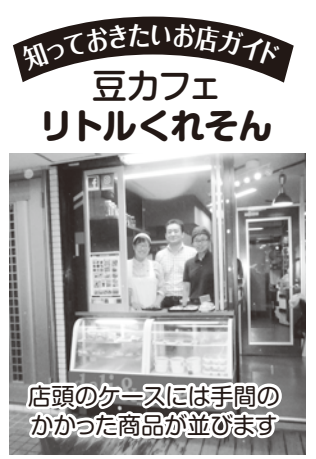
店頭のカフェには手間のかけた商品が並びます

からだに優しい弁当、総菜、スイーツを白砂糖と化学調味料を使わない独自のレシピで作っています。日替わり「健康ランチ」は看板商品。黒米と玄米を混ぜたご飯はもちもち、おかずはひじき煮、根菜と豚肉のトマト煮、春雨の和え物、魚の煮付けと卵炒めが盛り、素材の旨味が生きます。シフォンケーキ、白花豆入ガトーショコラなどスイーツ(250~380円)はキビ米餡とメープルシロップの甘さでしっとり食感。豆カレー弁当(550円)、3種のスープ(各180円)、甘露豆煮(150円)も人気です。コーヒー(220円)、小豆茶(250円)。火、水曜は果実やナッツ、多種多様な食材が入るチョップサラダ(350円)を販売。イトイン席も。介護事業会社が経営するカフェは、健康メニューを財布に優しい価格に設定、幅広いリピーター客を呼んでいます。【本記事中の価格は税込み】