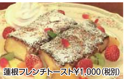
蓮根フレンチトースト¥1,000(税別)