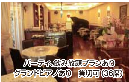
パーティ飲み放題プランあり グランドピアノあり 貸切可(36席)

※プレミアムフルコース(要予約)※ オードブル 3品 お肉料理とお魚料理 デザート ¥5,000(税別) ※人気のランチコース(5品)※ ¥1,500(税別) 11:00~14:30 ※日替りランチコースございます 10:00~20:00 毎週火曜・水曜定休