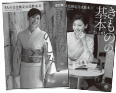
検定公式教本。右は「きもの基本」(ハーネスト婦人画報社) 2,160円(税込)、左は「きものたのしみ」(世界文化社) 2,160円(税込)

て、一文字結び、片流し結び、貝の口結びにも挑戦を。簡単に見栄えのよい兵児(へこ)帯は、使い勝手が良好。飾り紐やアクセサリを加えて、おしゃれ感増を目ざそう。 《所作など》ゆかたは和服なので、いつも以上にお上品に。大股歩きや小走りは着崩れのもと。肩の力を抜き、背筋を伸ばして下駄の前に重心をかけて歩きましょう。飲食時はハシカチを帯からひざの上にかけて。イスには浅くかけて帯の型崩れ防止。 《お手入れ》着用後はシミや汚れをチェック。自力で洗濯の場合は色落ちの確認後、たんで中性洗剤で押し洗い。陰干しにし、生乾きのころアイロンをかけます。不安な人は帯と合わせて、クリーニング店に任せを。通常、シーズン終了後でOK。