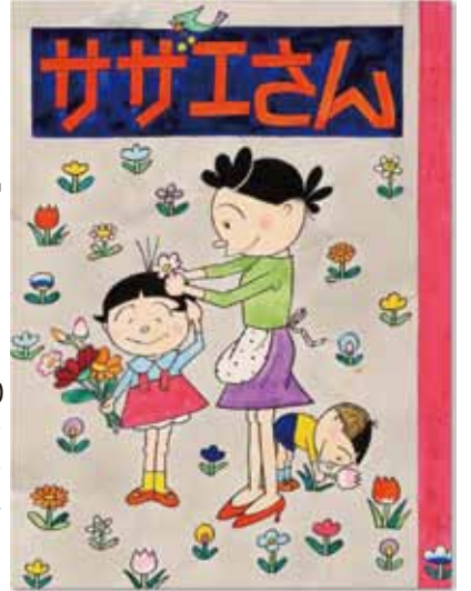
「サザエさん」第40巻 表紙原画 ©長谷川町子美術館

サザエさん生誕70年を記念して、生みの親・長谷川町子(1920-1992)の全貌がわかる「よりぬき長谷川町子展」が、8月27日から10月10日まで板橋区立美術館で開催。 1946年から今日まで、国民的人気を博している「サザエさん」の原画100点をはじめ「いじわるばあさん」「エプロンおばさん」、絵本の原画も出展。天才少女から晩年までそれぞれの時代の作品が楽しめます。100点以上の限定グッズが買えるショップ、カフェも開設。 愉快的な展覧会になりそう。 ☎ 3979-3251 板橋区立美術館 【招待券プレゼント】本紙読者10名様に抽選で招待券を進呈。3面のパズル応募要項を参照に「招待券希望」と明記。8月12日必着。