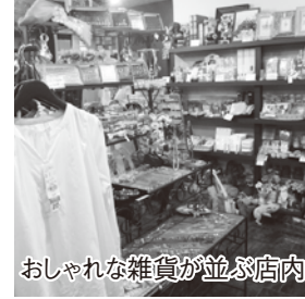
おしゃれな雑貨が並ぶ店内 高島平1-56-12 西台駅前交差点 AOKIとなり ☎03-3935-0239 水曜休 11:00~19:30 ※8/10~17夏期休業

きもの150点、人形300点余りが並び、カメラやタブレットを向ける人も。当日は写真体験、手づくり品販売、折り紙遊び、呈茶席などで参拝者はひとときを過ごしました。