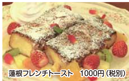
連根フレンチトースト 1000円(税別)