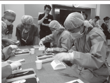
縫合体験はメスでスキンパッドを切開して閉じる練習

高島平中央総合病院は4月4日、医療に関心のある中学生対象の職場体験「スラックジャックセミナー」を実施! 応募者60人から抽選で男子11人、女子12人の生徒が参加しました。滅菌ガウンを着た生徒らは最新の手術室で6つの手術、検査に挑戦。超音波検査では患者役の腹部に探触子を当て、モニターの画像で観察。縫合体験はメスでスキンパッドを切開して閉じる練習。写真。細かな手順もすぐに習得。人工骨頭手術体験は、大腿骨頭を金属骨頭に置換術。特殊な器具での模擬手術も医師の指導で見事クリア。「筋肉を切っても痛まないのですか?」など質問も飛び、術後には拍手と歓声が上がる白熱ぶり。腹腔鏡手術、肩関節鏡手術、骨折治療の各体験にも真剣に取り組んでいました。私立中学3年の男子生徒は「器具が重く手首が疲れる。立ちっぱなしで、医師は体力が必要だと思った。パソコンのゲームと違う」と話し「出来たら医師になりたい」と声を弾ませます。地域貢献の一環として同病院初のセミナーは、研修医さんからの内容。「次世代の医師は君だ!」のエールに、生徒たちの眼は輝いていました。