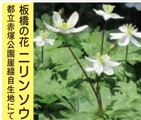
板橋の花二リンソウ 都立赤塚公園崖線自生地にて