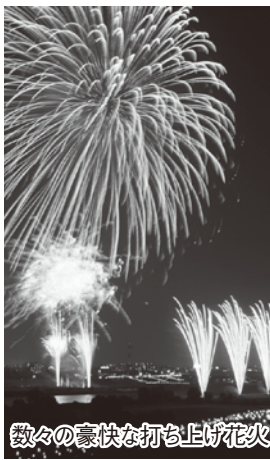
数々の豪快な打ち上げ花火

「第56回いたばし花火大会」(板橋区、板橋区観光協会主催)は8月1日(土)。荒川河川敷を会場に開かれる大会は見どころ満載の実力派。都内最大級の15号玉の打ち上げ、関東最大級長700mに及ぶ大ナイヤガラ、豪華絢爛スターメイン、妖怪ウオッチ花火が次々と夏の夜空を彩り、戸田市と同時開催により総打ち上げ数1万2千発。夏はそこまで。今年も涼しげな浴衣や甚平を着こんで、花火見物に出かけましょう。今からご準備を!