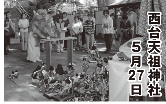
西台天祖神社 5月27日

キモノと節句人形に感謝してお別れする「第24回ご福まつり」(主催/西台天祖神社、高島平きものしんぶん 協賛/呉服や光永)は5月27日、西台天祖神社であり、キモノ約1000点、節句人形約400体が集まりました。初夏を思わせる好天に恵まれ、1000余人が参加。拜殿ではお祓い、祝詞奏上、玉串奉てんが行われ、長年手元にあった愛着あるキモノと節句人形の御霊抜き儀が、厳かに挙行されました。境内中央に並べられた品々を神職が清め、参加者は別れを惜しみました。授与された御札を手に「母親のきものを丁寧にお祓いしていただき、気持ちの整理が出来ました」と話す年配の人もいました。