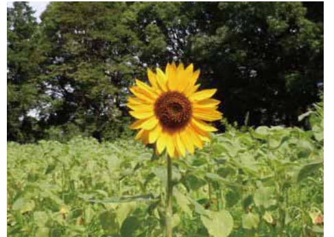
都立赤塚公園の圃場に、ひまわりが一輪。種一粒だけ早い時期にまかれ開花一番乗りになったようです。ぐんぐん伸びるひまわりは大人の背丈をはるかに越えます。このひまわりを眺めれば、テストや試合で一番になれる!