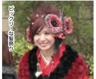
ビックリ!な髪飾り