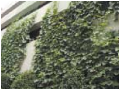
板橋区役所に緑のカーテンを施工 杉並区の小学校、5校でも施工しました

緑のカーテンは、アサガオやヘチマ、キュウリ、ニガウリなどの植物で作ったエコなカーテン。種や苗から始まりだんだん夏に向けて上へ上へと育っていきます。緑は日差しが当たると蒸散作用が活発になって葉の表面の温度上昇が抑えられるので、すだれよりずっと涼しく葉の間から涼しい風が流れ込みます。当社施工の緑のカーテンの生育状況をホームページで実況中継中。「緑のカーテン」で検索OK!地球に優しい暮らしませんか。