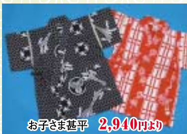
おひさま甚平 2,940円より