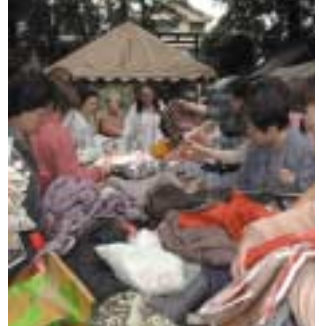
古着市では掘り出し物どっさり。