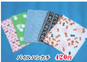
パイルハンカチ 420円