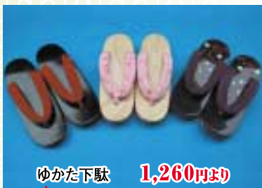
ゆかた下駄 1,260円より