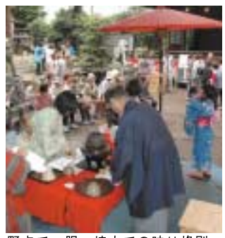
野点で一服。境内での味は格別。