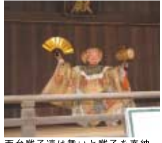
西台雛子連は舞いと雛子を奉納。