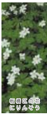
板橋区の花 にりんそう