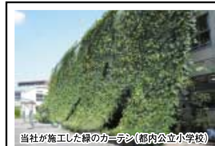
当社が施工した緑のカーテン(都内公立小学校)

「草かんむり」はゲートが開いている日はいつでも入場できます。散歩の休憩にぜひ、お立ち寄りください。ルーフガーデンでランチタイムもOKです。入場・利用料は無料。団体でのご利用も歓迎(要予約)。地域の皆様のお越しをお待ちしています。