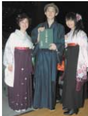
おしゃれ君登場。女子の大きな髪飾りに注目。