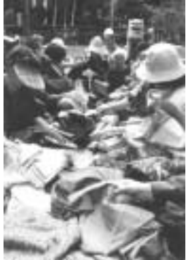
古着チャリティー市は大盛況