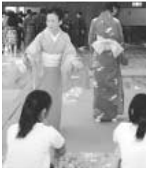
生徒に要点を説明します。

「みなさんおはようございます」とあいさつをすると、「おはようございます」と少し緊張気味な声が返ってきました。6月14日、板橋区立向原中学校で全10回に及ぶ「伝統文化こども教室」の始まりです。日ごろ接する機会が少ない着物の扱い方や礼儀作法を身に付けてもらえるよう、総合学習の時間を使い、2年生全員にわか