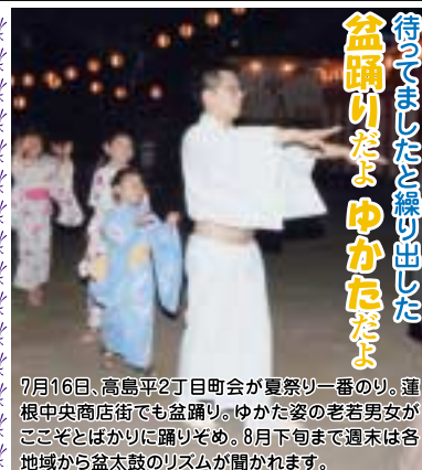
7月16日、高島平2丁目町会が夏祭り一番のり。蓮根中央商店街でも盆踊り。ゆかた姿の老若男女がここぞとばかりに踊りぞめ。8月下旬まで週末は各地域から盆太鼓のリズムが聞かれます。