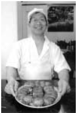
全国20余店の1店。焼餃子10個368円。甘みとコクが特長。